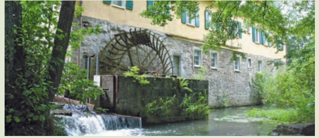
Reinharts- oder Volksmühle